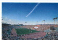
広域イベントの連絡用に