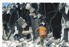
災害や緊急時の連絡用に

日常業務連絡用途と共に、災害発生時の業務継続において、国や地方自治体、大手企業など多くの現場で MCA 無線を活用いただいています。