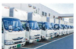
運送・警備などの日常業務用に