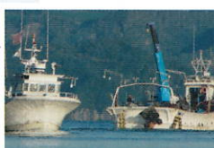
海上や船舶での連絡用に